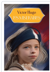
Los Miserables - ANIVERSARIO 15 AÑOS Victor Hugo