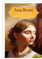
La inquilina de Wildfell Hall - ANIVERSARIO 15 AÑOS Anne Brontë