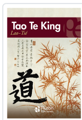
TAO TE KING Tsé, Lao