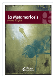
LA METAMORFOSIS Kafka, Franz