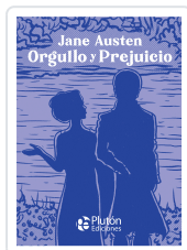
Orgullo y Prejuicio Austen, Jane