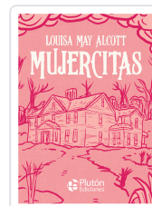
Mujercitas Alcott, Louisa May