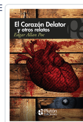
EL CORAZON DELATOR Poe, Edgar Allan