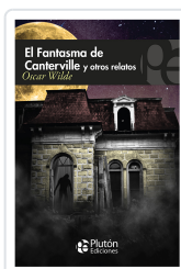
EL FANTASMA DE CANTERVILLE Y OTROS RELATOS Wilde, Oscar