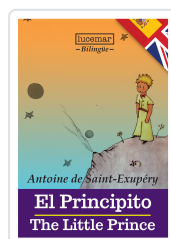
EL PRINCIPITO. Bilingüe Antoine de Saint-Exupéry