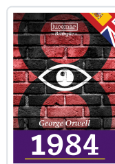
1984. Bilingüe George Orwell