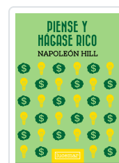
Piense y hágase rico - Tapa Dura NUEVO Napoleón Hill