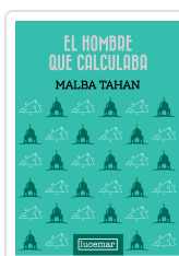
El hombre que calculaba - Tapa Dura NUEVO Malba Tahan