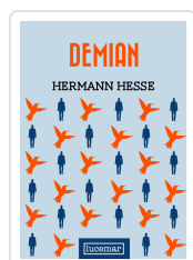
Demian - Tapa Dura NUEVO Hermann Hesse