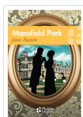
MANSFIELD PARK Austen, Jane