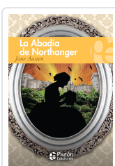
LA ABADIA DE NORTHANGER Austen, Jane