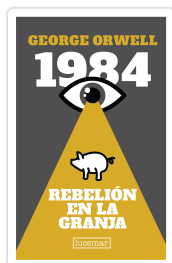
1984 / REBELION Col. LUCEMAR LUJO George Orwell