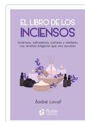
El libro de los incensos Lavall, Barbé