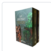
PACK H.P. LOVECRAFT Lovecraft, H.P.; Tapia, Javier