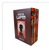
PACK ARSENE LUPIN Leblanc, Maurice