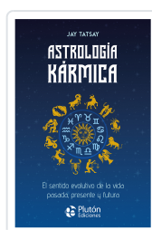
Astrología Kármica Tatsay, Jay