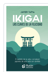
Ikigai: Las claves de la felicidad Javier Tapia